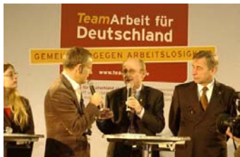
Reinhold Beckmann im Gespräch mit Willy Lemke und Wolfgang Clement